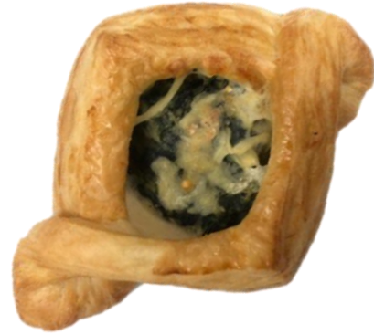
ลักษณะรูปทรงผิดปกติ